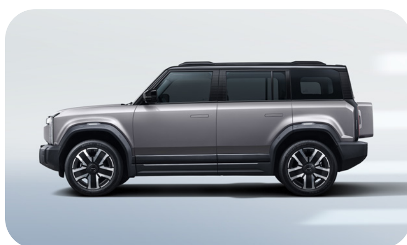
Gris Techo Negro