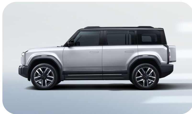
Plata Techo Negro