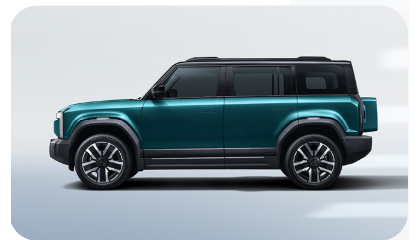
Verde Techo Negro