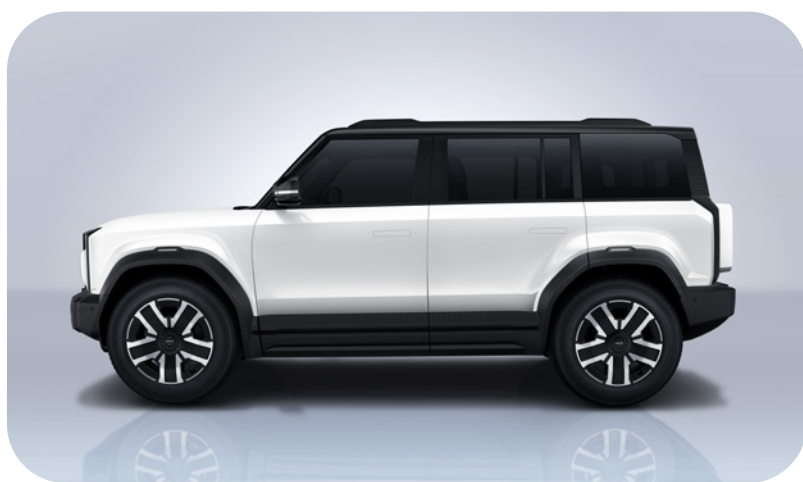
Blanco Techo Negro